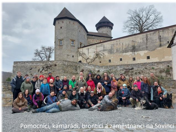
Pomocníci, kamarádi, brontíci a zaměstnanci na Sovinci

Nechejte se překvapit. Plánů mám spoustu, nicméně zatím ještě není správná doba na jejich zveřejnění. I v dalších letech nás čekají stavební úpravy, otevírání dosud nepřístupných částí hradu a samozřejmě velké množství rozmanitých kulturních akcí.