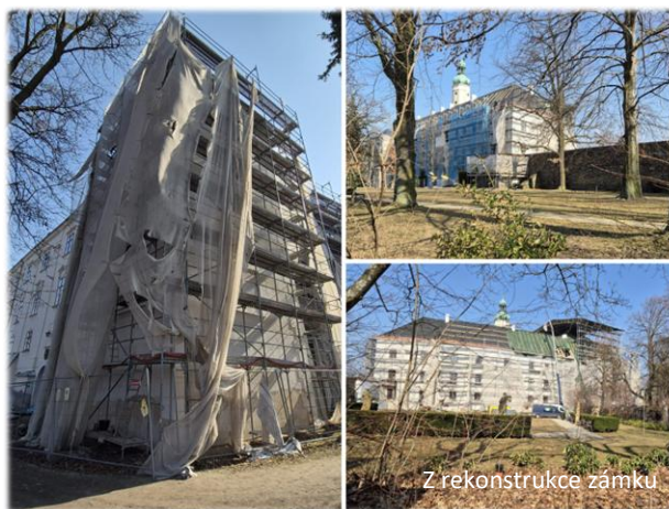
Z rekonstrukce zámku

Právě probíhající rekonstrukce zámku vstoupila do svého posledního roku. Většina oken na vnější straně budovy zámku je již opravena či zcela nově vyrobena a nahrazena. Dokončena je také část fasády, především v části směrem k sala terreně. V těchto týdnech probíhá revitalizace střechy nad hlavním vstupem, která patří k technicky nejnáročnějším etapám celé obnovy. Práce však opakovaně ovlivňují povětrnostní podmínky, a tak další postup bude záviset na aktuálním počasí.