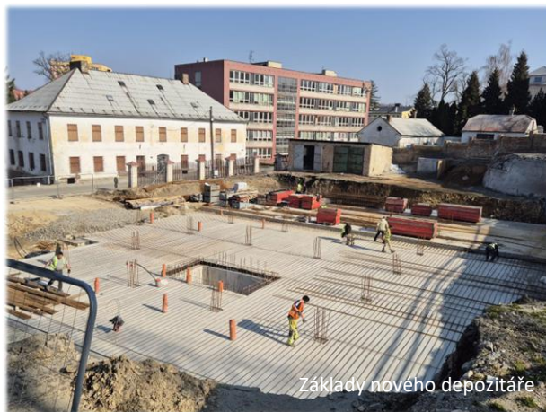
Základy nového depozitáře

Nový depozitář umožní centralizovat uložený materiál, zajistit lepší klimatické a bezpečnostní podmínky a zároveň vytvořit moderní zázemí pro práci se sbírkami – od evidence až po konzervátorské zásahy. Následovat bude fáze vybavení, stěhování sbírek a zkušební provoz. Plnému účelu by měl depozitář sloužit od roku 2027.