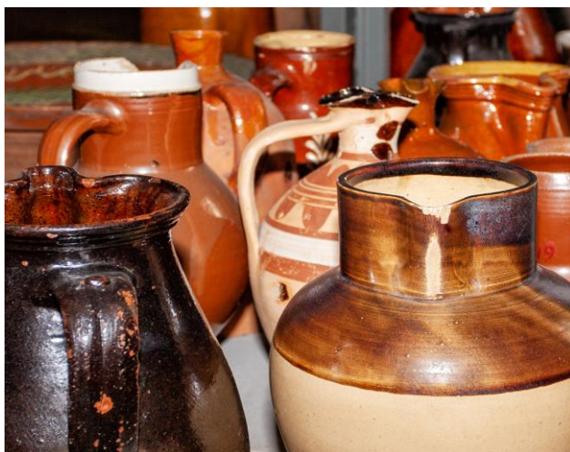
Keramika – etnografický depozitář

Muzeum v Bruntále je regionální vlastivědné muzeum s již více než stoletou historií. Za celé období své existence nashromáždilo bohatou sbírku mapující místní historii, umění, kulturu, každodenní život místních obyvatel i přírodu. Tato dokumentace historie a přírody prostřednictvím trojrozměrných svědků minulosti je nikdy nekončící prací muzejních pracovníků. Čas nikdo nezastaví a doba, na kterou naši rodiče vzpomínají jako na mládí, je pro naše děti vzdálenou a často nepochopitelnou minulostí. Změnami rovněž prochází přírodní prostředí, některé druhy zanikají a invazivní druhy se přizpůsobují novým podmínkám.