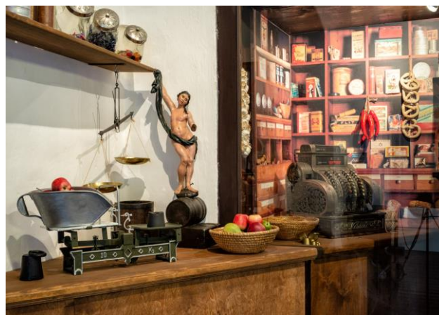
Expozice „Řemeslo má zlaté dno“

Nezbytní jsou pak v této věci také ochotní a milí průvodci , kteří přicházejí do přímého kontaktu s návštěvníky.